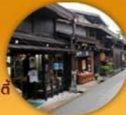
ย่านเมืองเก่า ถนนฮันมาชิซึ