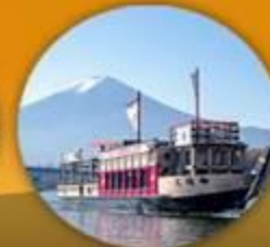
ล่องเรือ ซามูโรอาปาเระ