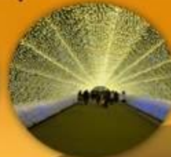
อุโมงค์ไฟ นาบะเนโนะซาโตะ