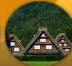
มรดกโลก หมู่บ้านชิราคาวาโกะ