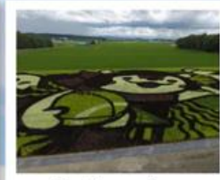
ศิลปะบนนาข้าว