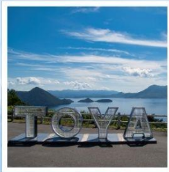
จุดชมวิวจิโตะ

ชมวิวที่สวยงามที่สุดบนทะเลสาบโทยะ ณ จุดชมวิวจิโตะ เมืองสุดแสนโรแมนติก กับถนนสายของหวานชื่อดัง โอตารุ ศิลปะบนนาข้าว เรื่องราวในทุ่งนาสะท้อนจิตวิญญาณแห่งฮอกไกโด ที่ 1 ปี มีครั้งเดียว กิน กิน และ กิน จุใจไปกับเมล่อนเย็นฉ่ำแบบไม่อื่น ชมฟาร์มโคนมชื่อดัง นิเซโกะ ทาคาฮาชิ กับวิวโยเทสแปพิเศษ สวนดอกไม้กับวิวเทือกเขาที่โด่งดังที่สุดแห่งฮอกไกโด ณ สวนซิกิโซโนะโอะกะ พักออนเซ็น 1 คืน!!! พักในเมืองซัปโปโร 2 คืน เมนูพิเศษ...บุฟเฟ่ต์เมล่อน, บุฟเฟ่ต์ซาบู, บุฟเฟ่ต์ซาบู, บุฟเฟ่ต์บึงย่าง กรุ๊ปสบายๆ เพียง 20 ท่านเท่านั้น!!!