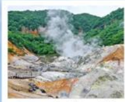
หุบเขานรก จิโกะคุดามิ