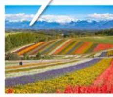
สวนดอกไม้ซึกิโซโนะโอกะ