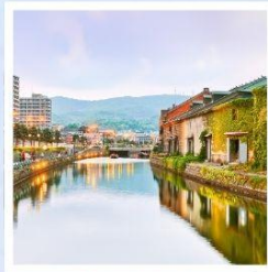
เมืองโอตารุ