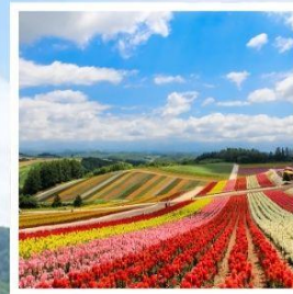
สวนดอกไม้ซิกิโซโนะโอะกะ