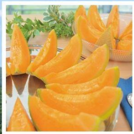
ศูนย์จำหน่ายเมล่อนยูบาริ