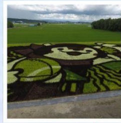
ศิลปะบนนาข้าว