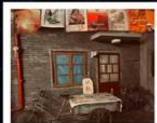
คาเฟ่ช้อปปิ้งยุคเหอผิง