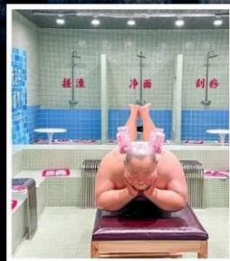
คาเฟ่ยิวนยุคเหอผิง