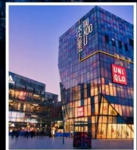
ย่านซานหลี่ถุน