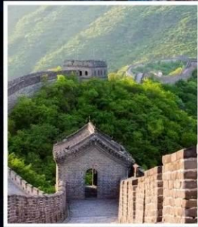
กำแพงเมืองจีน มู่เตียนยวี