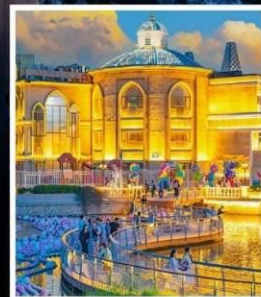
ห้าง SOLANA CENTER