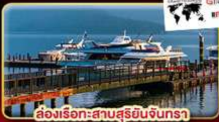
ล่องเรือทะเลสาบสุริยอันจนตรา

"นั่งรถไฟชมอุทยานอาลีซาน" ปลอ่ยโคมลอยเส้นทางรถไฟผิงซี