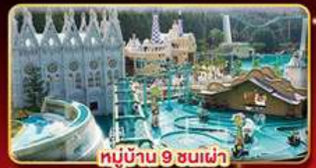
หมู่บ้าน 9 ชั้นฟ้า