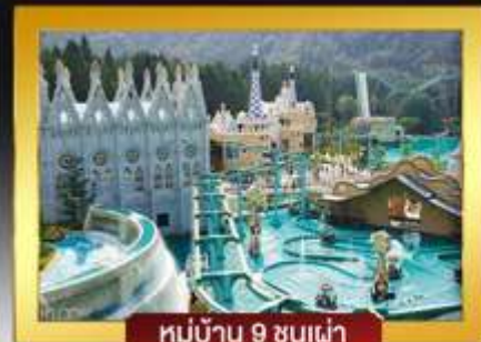
หมู่บ้าน 9 ขนเผ่า