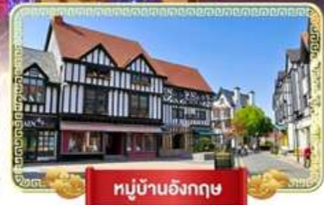
หมู่บ้านอังกฤษ