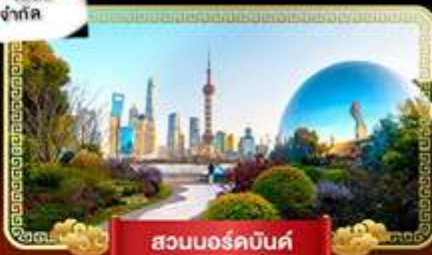
สวนนอร์คบันด์