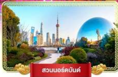
สวนนอร์คบินด์

• ถ่ายรูปเช็คอินสวนนอร์มัลด์ เดินเล่นชินเทียนตี้