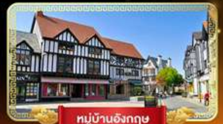
หมู่บ้านอังกฤษ