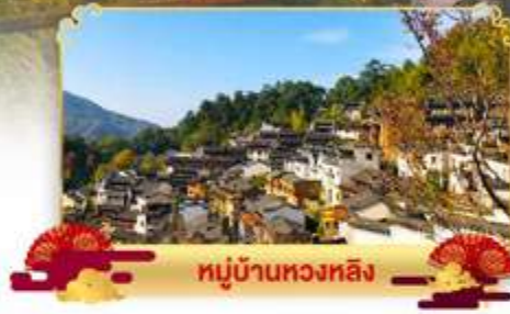
หมู่บ้านหวงหลิ่ง