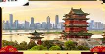
หอถึงหวังเก้อ