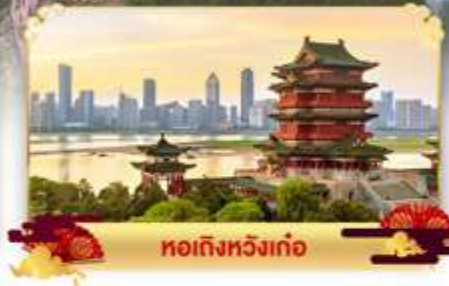
หอถึงหวังก้อ