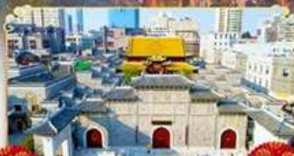
ถนนโบราณวั้งโซ่กวง