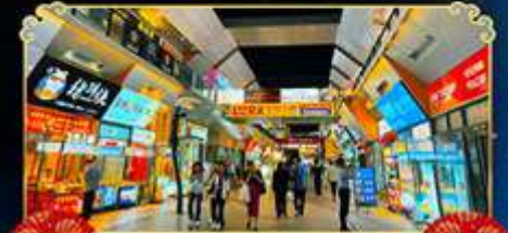
ถนนจินเจีย