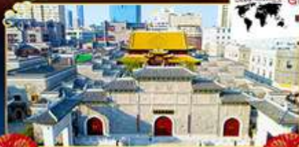
ถนนโบราณวังโซวกง

เยือนหมู่บ้านริมผา “หมู่บ้านเทวดาวังเซียนกู่”