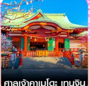
ศาลเจ้าคามโมโตะ เกนจิน