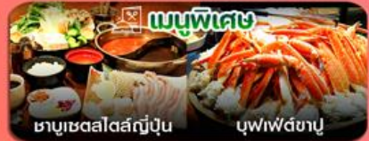
เมนูพิเศษ ชาบูเซตสึสึญี่ปุ่น บุฟเฟ่ต์ชาบู

ถนนนากามิเสะ-หมู่บ้านน้ำใสโอชิโนะ ซากไก-ทะเลสาบคาวากุจิโกะ-สวนโออิชิ พาร์ค-พิพิธภัณฑ์แผ่นดินไหว-โตเวอร์ซิตี โอโดบะ-ตลาดปลาชิคจิ-ฮอบบิงฮินจูกุ