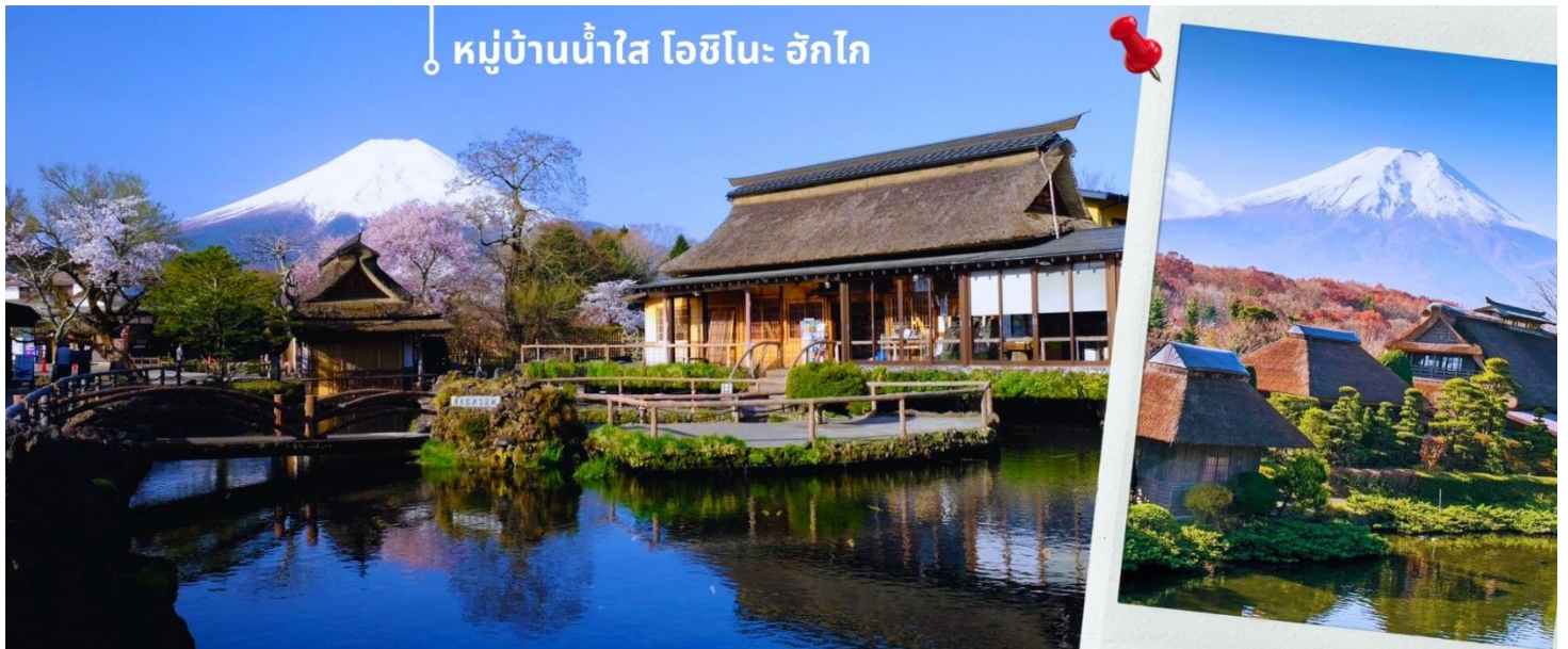
หมู่บ้านน้ำใส โอชิโนะ ฮักโกะ

พอสมควรแก่เวลานำท่านสู่ หมู่บ้านน้ำใส โอชิโนะ ฮักโกะ Oshino Hakkai ถือเป็นหมู่บ้านแห่งการท่องเที่ยวที่ยังคงความอุดมสมบูรณ์ของธรรมชาติเอาไว้ได้อย่างดีในหมู่บ้านมีบ่อน้ำใสที่เป็นน้ำที่ละลายมาจากหิมะบนภูเขาไฟฟูจิที่มีความสวยงามในระดับที่ว่าได้รับการขึ้นทะเบียนให้เป็นมรดกทางธรรมชาติในปีค.ศ. 1934 และได้รับคัดเลือกให้เป็นหนึ่งในภูมิทัศน์ทางน้ำที่งดงามในปีค.ศ. 1985 อีกด้วยและยังเป็นอีกหนึ่งสถานที่ที่เราสามารถมองเห็นวิวฟูจิด้วยหากวันนั้นเป็นวันที่ฟ้าเปิด