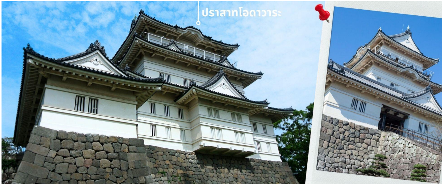
ปราสาทโอดาวาระ

พอสมควรแก่เวลานำท่านสู่ หมู่บ้านน้ำใส โอชิโนะ ฮักโกะ Oshino Hakkai ถือเป็นหมู่บ้านแห่งการท่องเที่ยวที่ยังคงความอุดมสมบูรณ์ของธรรมชาติเอาไว้ได้อย่างดีในหมู่บ้านมีบ่อน้ำใสที่เป็นน้ำที่ละลายมาจากหิมะบนภูเขาไฟฟูจิที่มีความสวยงามในระดับที่ว่าได้รับการขึ้นทะเบียนให้เป็นมรดกทางธรรมชาติในปีค.ศ. 1934 และได้รับคัดเลือกให้เป็นหนึ่งในภูมิทัศน์ทางน้ำที่งดงามในปีค.ศ. 1985 อีกด้วยและยังเป็นอีกหนึ่งสถานที่ที่เราสามารถมองเห็นวิวฟูจิด้วยหากวันนั้นเป็นวันที่ฟ้าเปิด