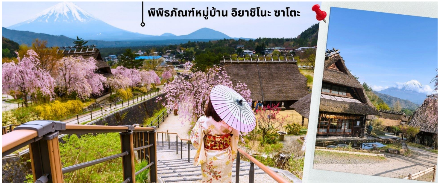
พิพิธภัณฑ์หมู่บ้าน อียาชิโนะ ซาโตะ

หลังรับประทานอาหารเช้า นำท่านเดินทางเข้าชม พิพิธภัณฑ์หมู่บ้านอียาชิโนะซาโตะ Saiko Iyashi No Sato ซึ่งตั้งอยู่บริเวณฝั่งตะวันตกของทะเลสาบไซโกะ เป็นหมู่บ้านโบราณที่ได้รับการบูรณะและฟื้นฟูขึ้นมาใหม่หลังจากถูกทำลายโดยพายุไต้ฝุ่นในปี 1966 ปัจจุบันกลายเป็นพิพิธภัณฑ์กลางแจ้งที่มีเอกลักษณ์ที่ผสมผสานประวัติศาสตร์ วัฒนธรรม และทัศนียภาพธรรมชาติอันงดงามเข้าด้วยกัน ให้ท่านได้สัมผัสวิถีชีวิตดั้งเดิมของชาวญี่ปุ่นในยุคโบราณ ท่ามกลางวิวภูเขาไฟฟูจิที่งดงามและไฮไลท์ของการเที่ยวพิพิธภัณฑ์หมู่บ้านอียาชิโนะซาโตะ คือตลอด 2 ข้างทางจะมีต้นซากุระขึ้นเรียงรายยิ่งทำให้ช่วยเพิ่มความสวยงามให้กับบรรยากาศโดยรอบบ้านที่หลังคามุงฟางรับกับวิวภูเขาไฟฟูจิเก็บไว้เป็นที่ระลึก