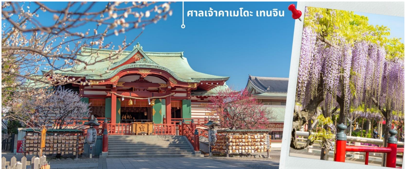
ศาลเจ้าคาเมโตะ เทนจิน

หลังจากนั้นจากนั้นนำท่านเดินทางสักการะ ขอพรกันที่ ศาลเจ้าคาเมโตะ เทนจิน Kameido Tenjin Shrine เป็นศาลเจ้าที่ตั้งอยู่เมืองโตเกียว ศาลเจ้าแห่งนี้สร้างขึ้นกว่า 350 ปี เพื่ออุทิศให้แก่นักปราชญ์ชื่อดังของญี่ปุ่นสุกาวะระ โนะ มิจิซานะ ศาลเจ้าแห่งนี้ขึ้นชื่อว่าเป็นสถานที่ยอดนิยมสำหรับนักท่องเที่ยวทั้งต่างชาติและนักท่องเที่ยวชาวญี่ปุ่น เนื่องจากเป็นสถานที่สำคัญในไหว้ขอพรเพื่อความปรารถนาดีแล้ว รวมถึงเรียนรู้ประวัติศาสตร์ผ่านศิลปะแล้วนั้น ภายในศาลเจ้าแห่งนี้ยังมีทัศนทางธรรมชาติที่สวยงามของดอกวิสทีเรีย ที่มีความโดดเด่นที่สะพานโค้งสีแดงกลางสระน้ำ สำหรับชาวญี่ปุ่น ดอกวิสทีเรีย (Wisteria) เป็นดอกไม้สำคัญอีกชนิดหนึ่งรองจากซากุระ โดยจะออกดอกสีม่วง