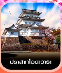
ปราสาทโอตาวาระ

คอนเฟิร์ม ออกเดินทาง ทุกวัน ฟรี ทุกพีเรียด 2 ท่าน ขึ้นไป