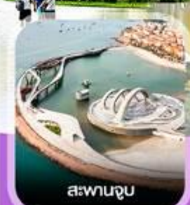
สะพานจูน

✈️ คอนเฟิร์มออกเดินทาง ทุกพีเรียด 2 ท่านขึ้นไป