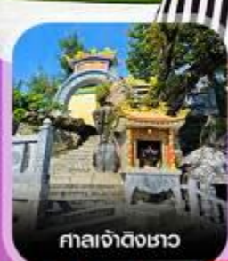
ศาลเจ้าดิ้งเซา