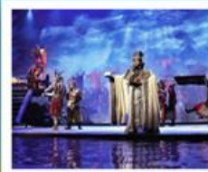
โชว์สามก๊ก