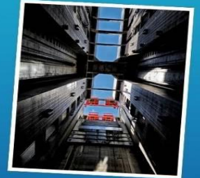
ลิฟท์ข้ามเขื่อนซานเสียดำป่า