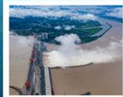
เขื่อนยักษ์ซานเสี่ยต้าป้า

มหาศาลาประชาชน / หงหยาดัง / ล่องเรือสำราญ แม่น้ำแยงซีเกียง / ถนนคนเดินเจียฝางเป่ย์ รถไฟทะลุคด / โชว์สามก๊ก / ช่องแคบชว้งตงเสี่ย / ช่องแคบอูเสี่ย / นั่งเรือเล็กชมเล่นหนี่ซี นั่งลิฟท์ข้ามเขื่อนซานเสี่ยต้าป้า / Three Gorges Project Museum