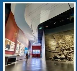
THREE GORGES PROJECT MUSEUM