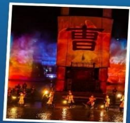
โชว์สามก๊ก