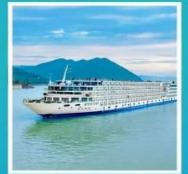
ล่องเรือสำราญ