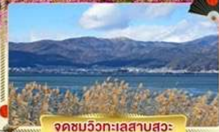
จุดชมวิวกะเลสาบสุวะ