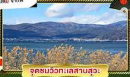
จุดชมวิวกะเลสาบสุวะ