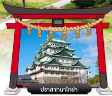
ปราสาทนาโกย่า