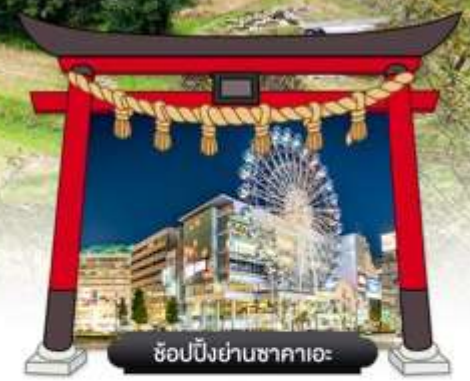
ช้อปปิ้งย่านซาคาเอะ