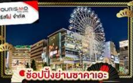
ช้อปปิ้งย่านซาคาเอะ