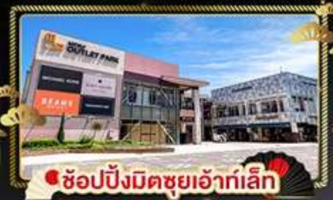
ช้อปปิ้งมิตซูเอ็กซ์แอ็กซ์