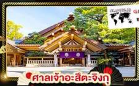
ศาลเจ้าอะสึตะจิงกุ