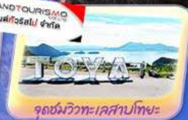
จุดชมวิวทะเลสาบโทยะ