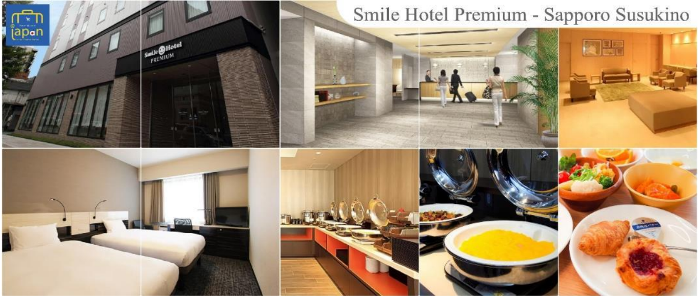
ที่พัก SMILE HOTEL PREMIUM - SAPPORO SUSUKINO หรือเทียบเท่าระดับเดียวกัน

เย็น รับประทานอาหารเย็น ณ ภัตตาคาร (4) พิเศษ!!! เมนู บุฟเฟต์ชาบู + ชาบู