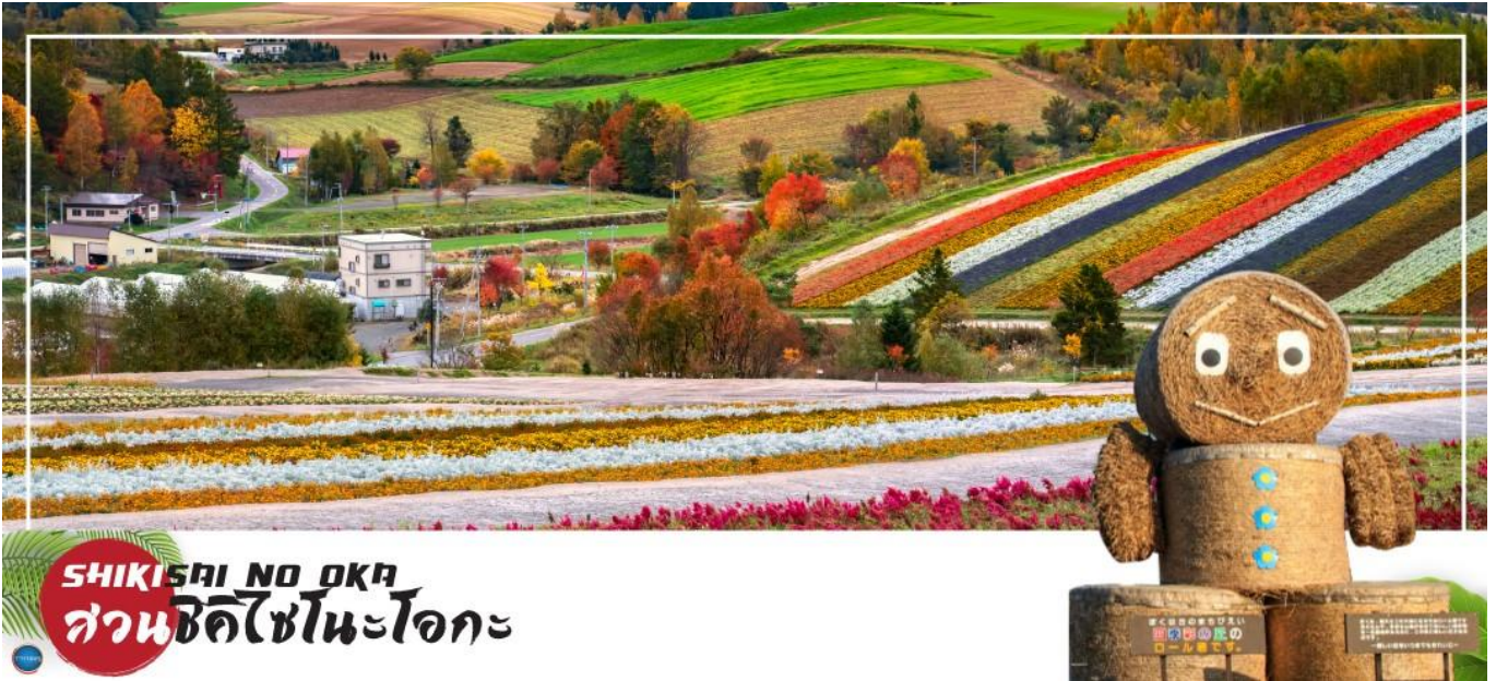
SHIKISAI NO OKA สวนชิคิไซโนะโอกะ