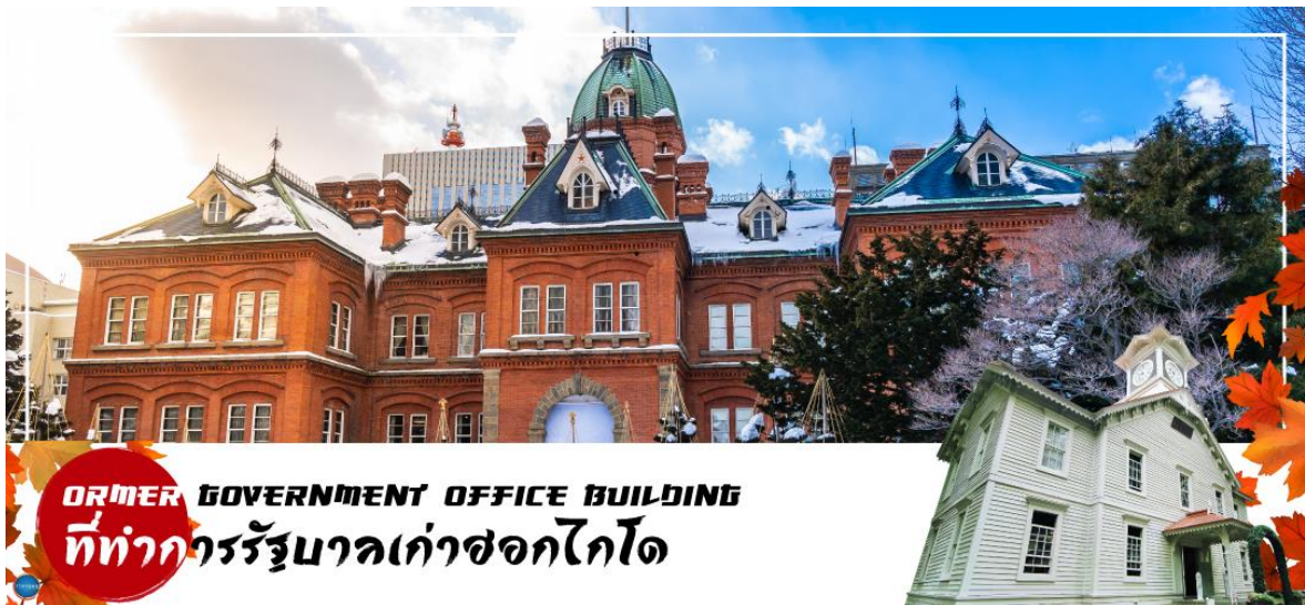
FORMER GOVERNMENT OFFICE BUILDING ที่ทำการรัฐบาลเก่าฮอกไกโด

นำท่านชม ศาลาว่าการเมืองฮอกไกโดหลังเก่า (ตึ้นนอก) (Former Hokkaido Government Office) เป็นอาคารสีแดงอิฐ สร้างในปี 1888 นับเป็นอาคารขนาดใหญ่แห่งหนึ่งในไม่กี่อาคารของญี่ปุ่นในสมัยนั้น ภายในตกแต่งอย่างหรูหรา ด้านหน้ามี สัญลักษณ์ดาวห้าแฉก ธงรูปดาวเจ็ดแฉก และสวนหย่อมที่ร่มรื่น เรียงรายด้วยต้นซากุระ และต้นแปะก๊วย อาคารแห่งนี้เคยเป็นที่ทำการรัฐบาลท้องถิ่นสมัยบุกเบิกเกาะฮอกไกโด ปัจจุบันเปิดให้ประชาชนเข้าชมห้องทำงานต่างๆ และหอสมุดเก็บบันทึกทางราชการ