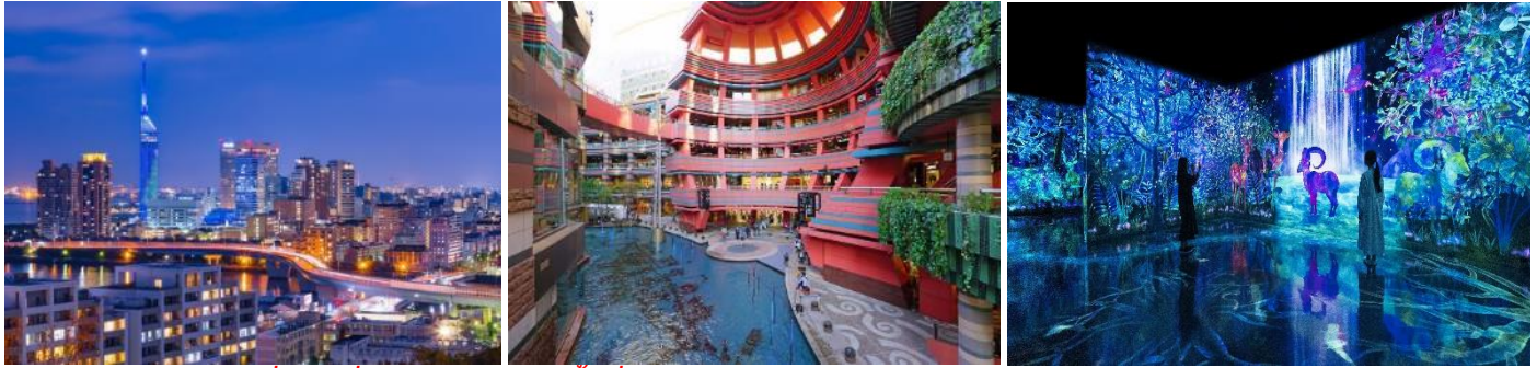
สถานที่ท่องเที่ยวและแหล่งช้อปปิ้งที่น่าสนใจ ณ เมืองฟูกูโอกะ

***อิสระท่องเที่ยวเต็มวัน*** ไม่มีรถบัสให้บริการ แต่มีไกด์แนะนำการเดินทางให้ท่าน