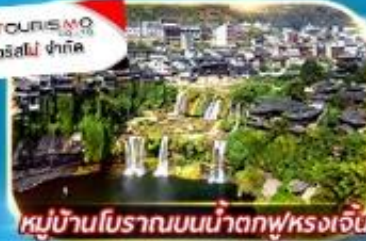
หมู่บ้านโบราณบนน้ำตกฟูหลงเจิน