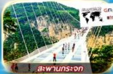
สะพานกระเจก