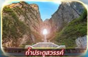
ทำประตูสวรรค์