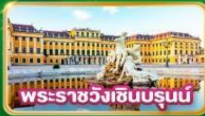
พระราชวังเชินบรุนน์