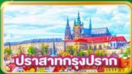
ปราสาทกรุงปราก