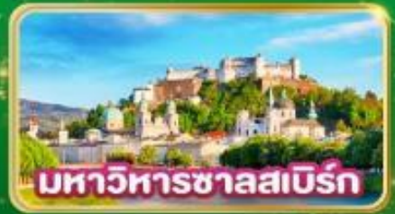
มหาวิหารซาลสเบิร์ก