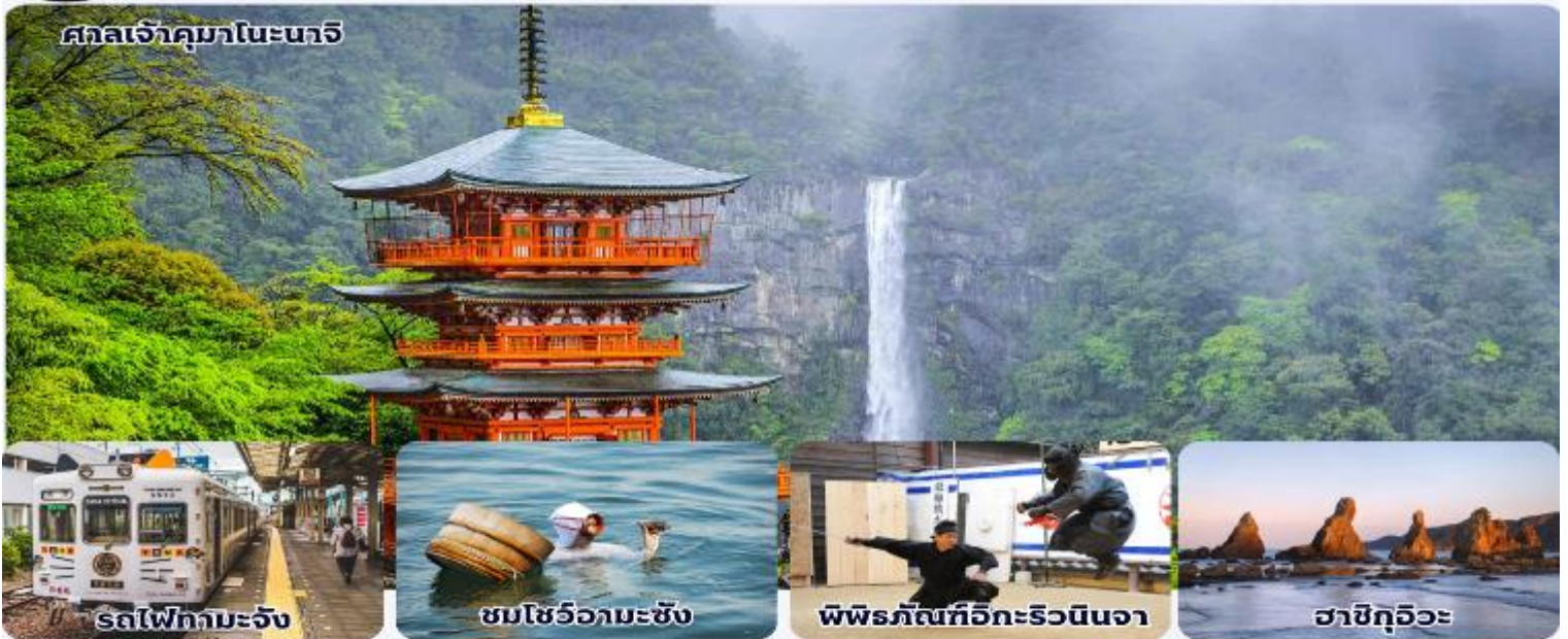
รถไฟทามะจิ