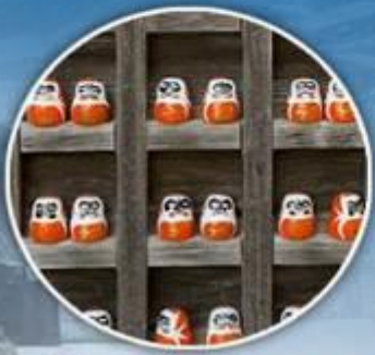
วัดแห่งชัยชนะ คัตสึโอจิ