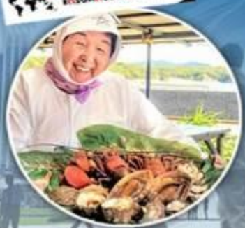
อาหารทะเล จากร้าน AMA HUT

ตลาดปลาคุโรชิโอะ / หน้าพาอาชิงอุวะ ศาลเจ้าคุมาโนะนาจิ / เกาะไข่มุกมิกิโมโตะ ศาลเจ้าฮิเสะ / ถนนโออาโรมาจิ พิพิธภัณฑ์อิเคะริวจินจา / มิตซึยาเอะก้าเก็ต / ฮิโอบุ