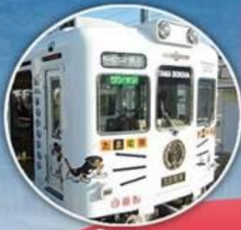
นั่งรถไฟ ทามะจิง