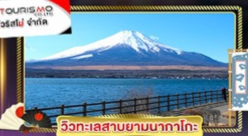
วิวทะเลสาบยามานากาโกะ