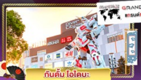
กันดั้ม โอไดบะ