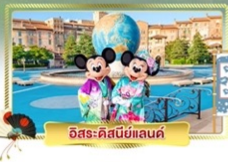
อีสรเชอปปิงตามอริยาซัย