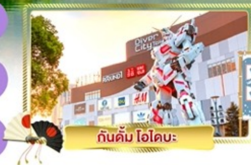
กันดั้ม โอโดบะ