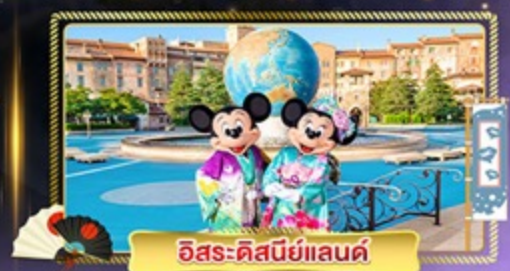
อิสระ-ดิสนีย์แลนด์