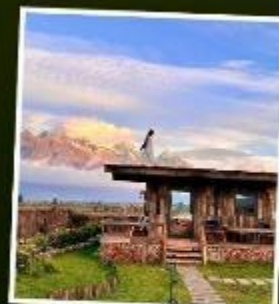
YUN DI AN CAFE