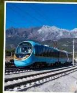
รถไฟชมวิว ภูเขาหิมะมังกรหยก