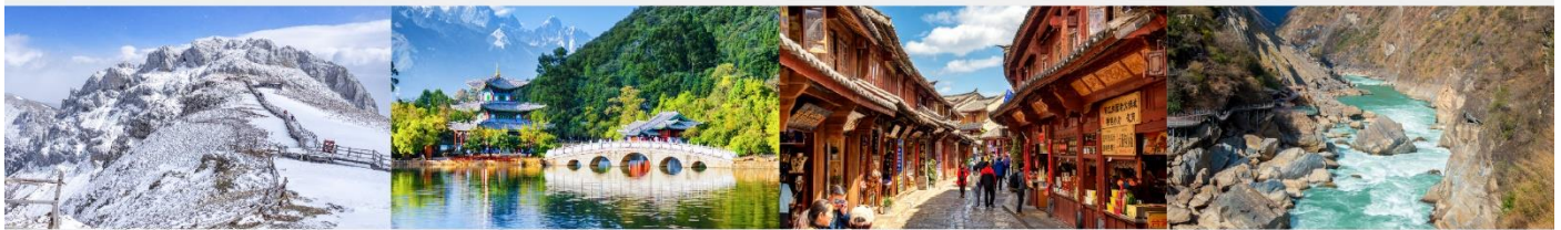
ภูเขาหิมะสี่อ่า