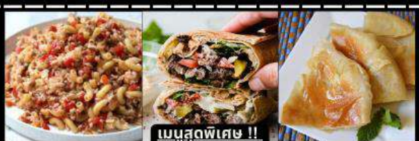
เมนูสุดพิเศษ !! KOSHARI (ข้าวคลุกถั่ว) / SHAWERMA (เนื้อห่อแป้ง) / FITEER BALADI (พืชข้าอียิปต์)