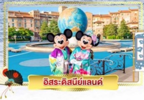
อิสระ-คิสนีย์แลนด์