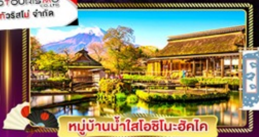
หมู่บ้านน้ำใสโอฮิโนะฮิโค