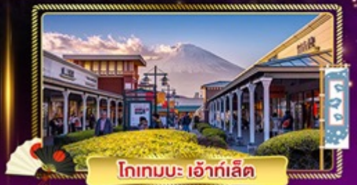
โทเทมบะ เอ้าท์เล็ต