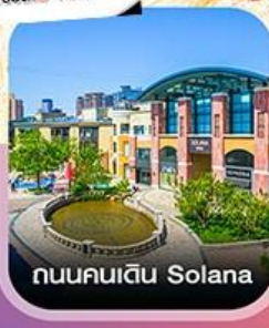
ถนนคนเดิน Solana

✈️ คอนเฟิร์มออกเดินทาง ทุกพีเรียด 2 ท่านขึ้นไป