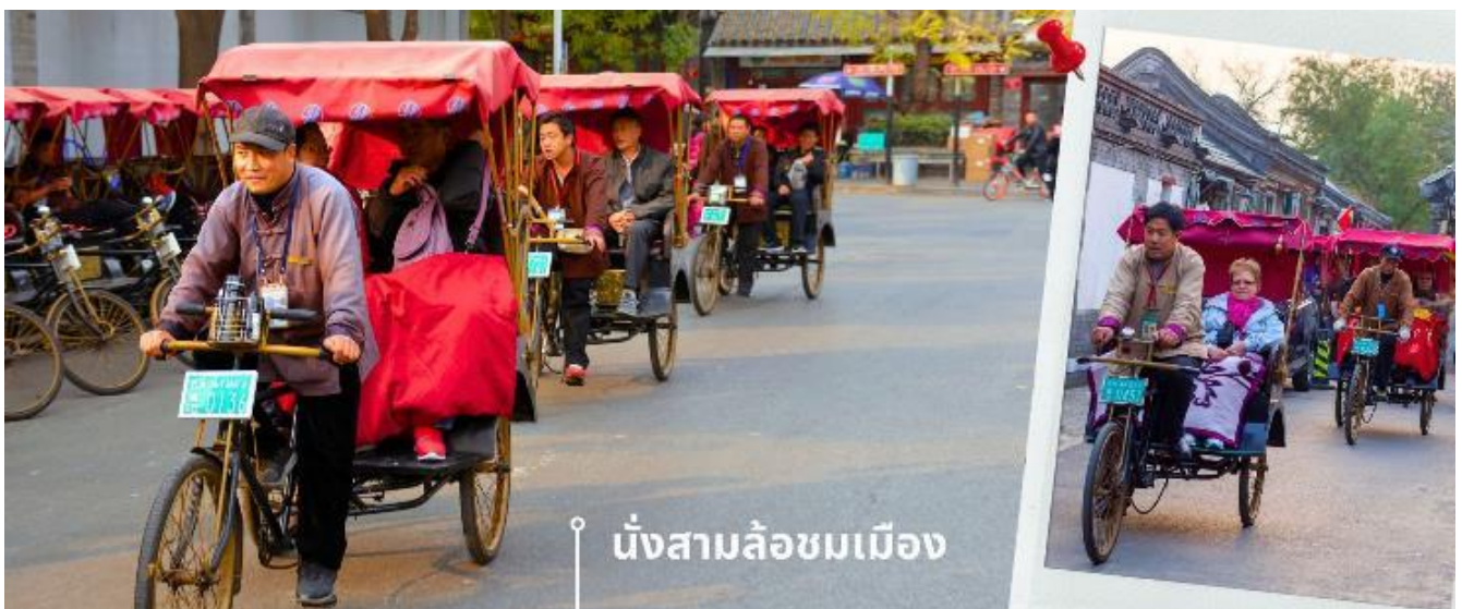
นั่งสามล้อชมเมือง

พอสมควรแก่เวลานำท่านเดินทาง นั่งสามล้อชมเมืองโบราณหูท่ง สามล้อถือเป็นอีกหนึ่งขนส่งหลักของประเทศจีน การนั่งสามล้อเที่ยวชมเมืองเป็นที่นิยมของนักท่องเที่ยว เมืองหูท่งเต็มไปด้วยย่านที่อยู่อาศัยแบบดั้งเดิมของชาวปักกิ่งที่มีมาตั้งแต่สมัยราชวงศ์หยวน โดยเป็นบ้านอิฐชั้นเดียวมุงด้วยกระเบื้องสีเทาตั้งเรียงชิดกันตามตรอกซอกซอยเป็นผังเมืองตามแนวตั้งและแนวนอนคล้ายตารางสี่เหลี่ยม