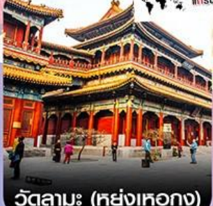
วัดลามะ (หย่งเหอวก)