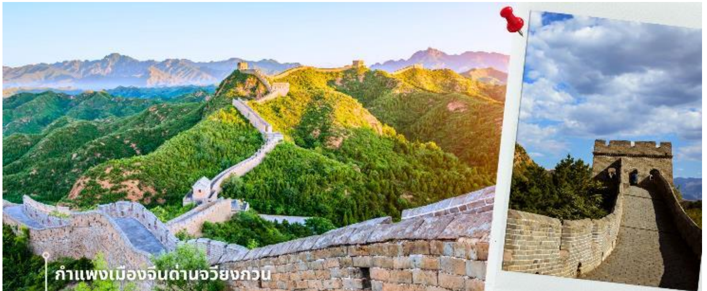
กำแพงเมืองจีนด่านจวิยงกอบ

เป็น 1 ใน 8 จุดชมวิวที่มีชื่อเสียงของปักกิ่งมาตั้งแต่สมัยราชวงศ์ฉิน จากนั้นนำท่านแวะชมสินค้าจากร้านชา ให้ท่านได้เลือกซื้อผลิตภัณฑ์จากใบชาเพื่อสุขภาพ