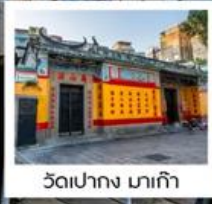
วัลเปาอง มาเก๊า