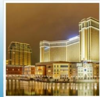
เดอะ เวเนเชียน

ถนนคนเดินสุดชิคไม่เหมือนใคร ณ คารุอิชาว่า กินซ่า สตรีท ฮาคูบะอิวาตะเกะ ระเบียงกระจกที่สวยงามที่สุดแห่งฮาคูบะ คามิโคจิ สัมผัสมนต์เสน่ห์สวิตเซอร์แลนด์แดนญี่ปุ่น คุซัทสึออนเซ็น เมืองออนเซ็นอันทรงเสน่ห์ที่ต้องมาเยือน จุดชมวิวแห่งใหม่ในสวนสนุก ฟูจิวอล์กแลนด์ กราบไหว้ขอพรกับเทพเจ้าองค์ไท่ส่วยเอี้ย วัดเปากง สัมผัสความอลังการของ เดอะ เวเนเชียน รีสอร์ทระดับเวิลด์คลาส พักกลางแหล่งช้อปปิ้ง 2 คัน พักออนเซ็น 1 คัน!!! อาหารพิเศษ...บุฟเฟ่ต์ซาบูยักซ์, บุฟเฟ่ต์ซาบู, หม้อไฟโฮโต กรู๊ปสบายๆ เพียง 25 ท่านเท่านั้น!!!