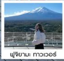
ฟูจิยามะ: ทาวเวอร์