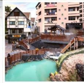
คุซัทสึ ออนเซ็น