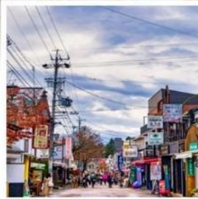
ถนนช้อปปิ้งคารุอิชาว่า