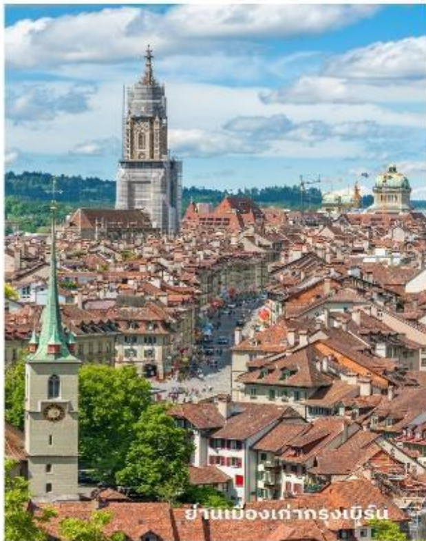
ย่านเมืองเก่ากรุงเบิร์น