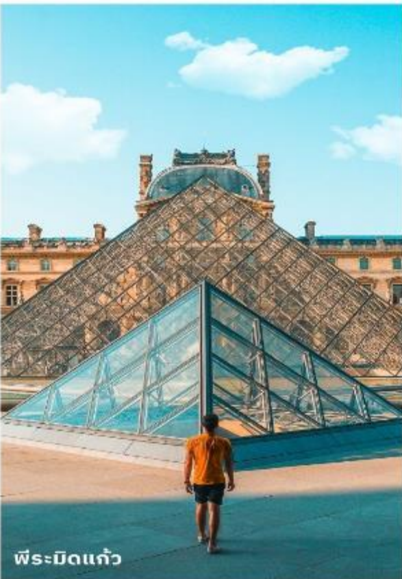
พีระมิดแก้ว

เดินทางสู่ พิพิธภัณฑ์ลูฟร์ ให้ท่านได้ถ่ายรูปด้านหน้า พีระมิดแก้วของพิพิธภัณฑ์ลูฟร์ เป็นพิพิธภัณฑ์ทางศิลปะที่มีชื่อเสียงที่สุด เก่าแก่ที่สุดและใหญ่ที่สุดแห่งหนึ่งของโลก