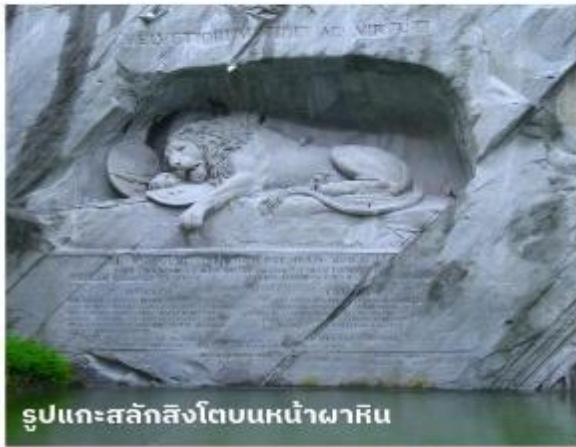
รูปแกะสลักสิงโตบนหน้าผาหิน

อาหารเช้า : ✓ อาหารกลางวัน : ✓ อาหารเย็น : ✓