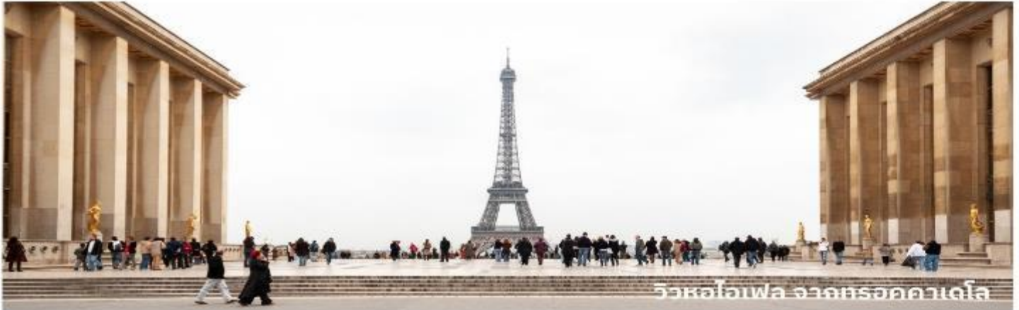
วิวหอไอเฟล จากตรอกคาเดไล