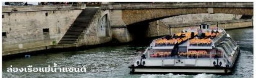
ล่องเรือแม่น้ำแซนต์

จากนั้นนำท่าน ล่องเรือบาโตมุช (Bateaux Mouches River Cruise) เรือล่องไปตามแม่น้ำแซนที่ไหลผ่านใจกลางกรุงปารีส ชมความสวยงามของสถาปัตยกรรมอันคลาสสิกของอาคารต่างๆ