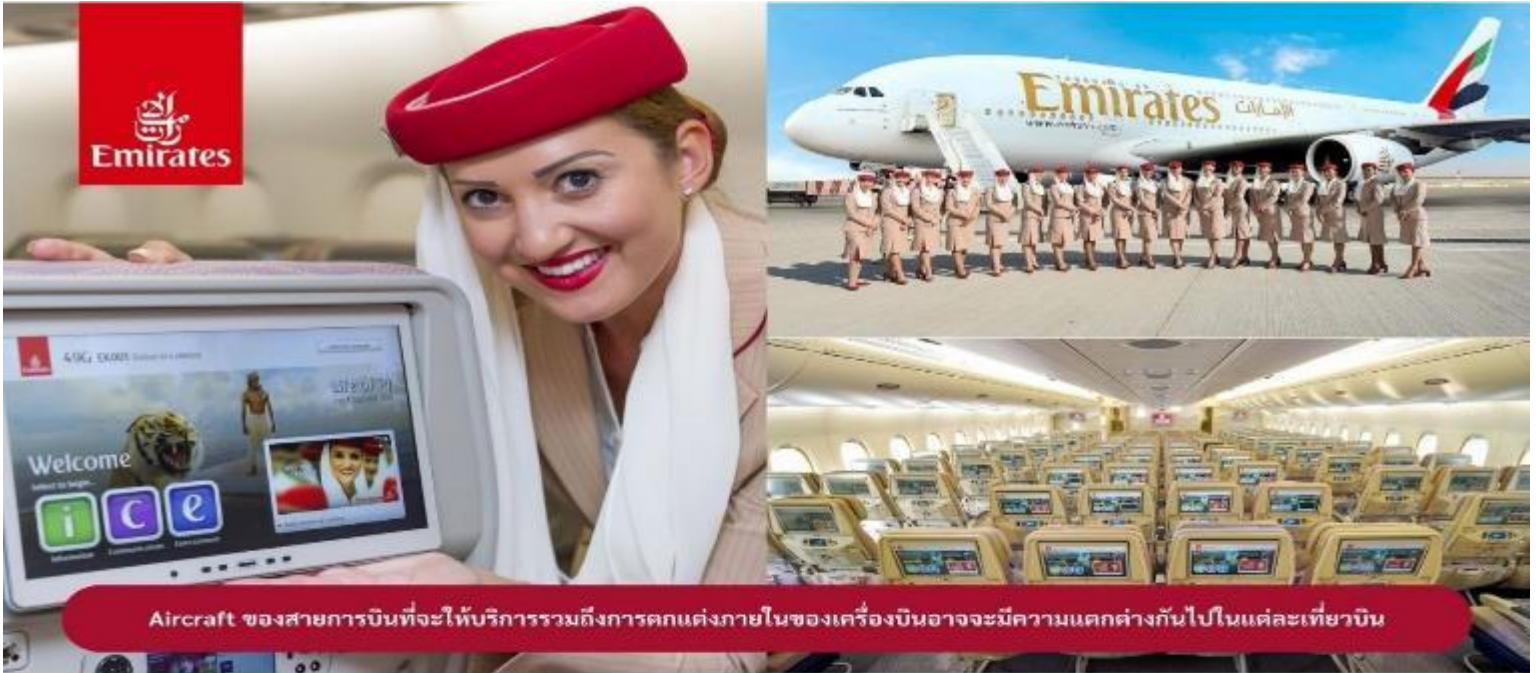
Aircraft ของสายการบินที่จะให้บริการรวมถึงการตกแต่งภายในของเครื่องบินอาจจะมีขนาดแตกต่างกันไปในแต่ละเที่ยวบิน