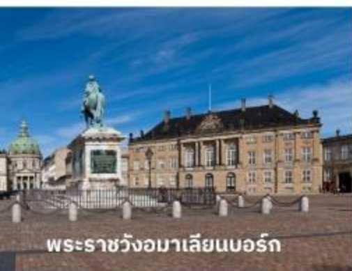
พระราชวังอมาเลียนบอร์ก