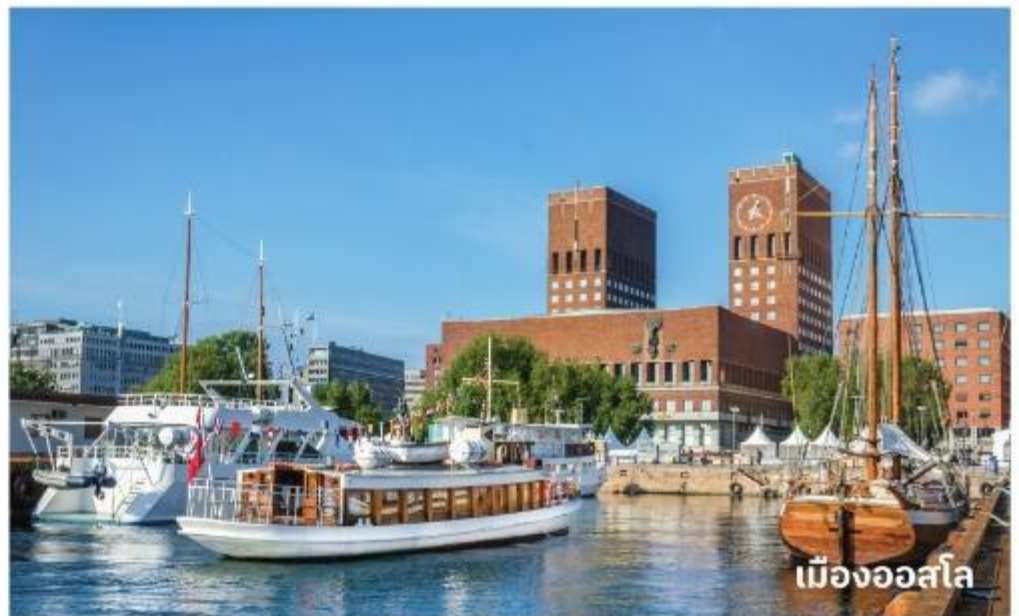
เมืองออสโล