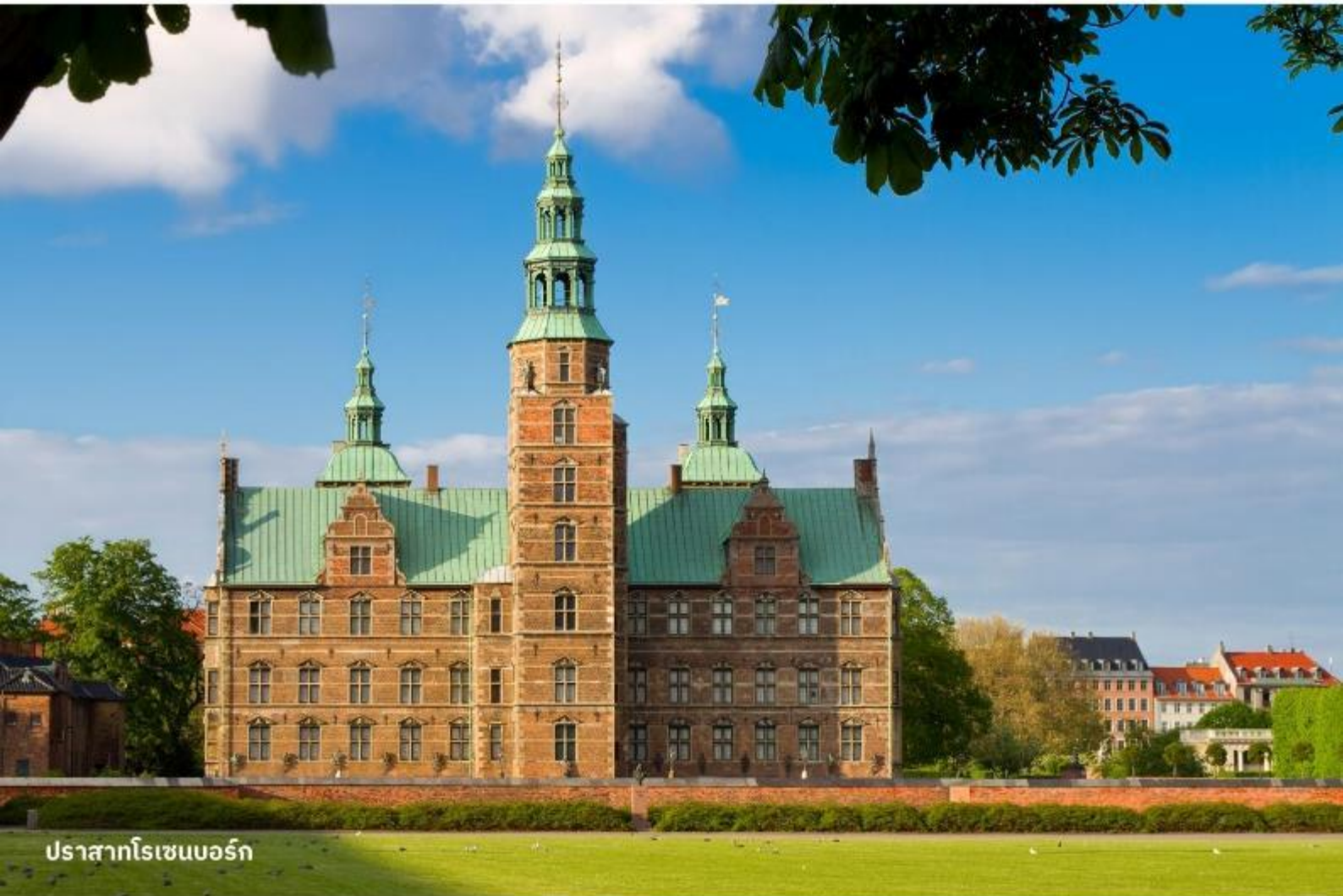
ปราสาทโรเซนบอร์ก

จากนั้นนำท่านเข้าชม ปราสาทโรเซนบอร์ก พระราชวังฤดูร้อนใจกลางเมืองโคเปนเฮเก้น เป็นพระราชวังที่มีอายุเก่าแก่กว่า 400 ปี โดยสถาปัตยกรรมของพระราชวังโรเซนเบิร์กนั้นได้รับอิทธิพลมาจากสถาปัตยกรรมรูปแบบเรอเนสซองส์ ซึ่งไฮไลท์สำคัญในการเข้าชมคือการชมเครื่องราชกกุธภัณฑ์ (The Crown Jewels) ของราชวงศ์เดนมาร์ก ซึ่งเป็นสมบัติล้ำค่าที่สุดที่จัดแสดงอยู่ที่นี่