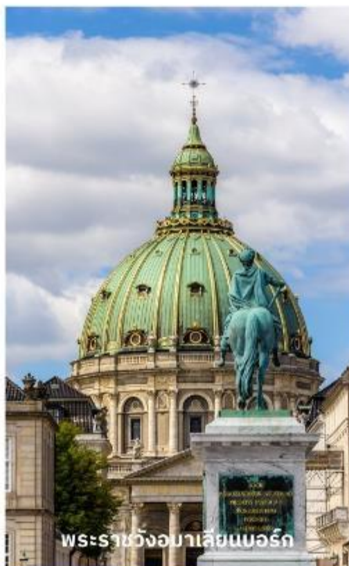
พระราชวังอมาเลียนบอร์ก