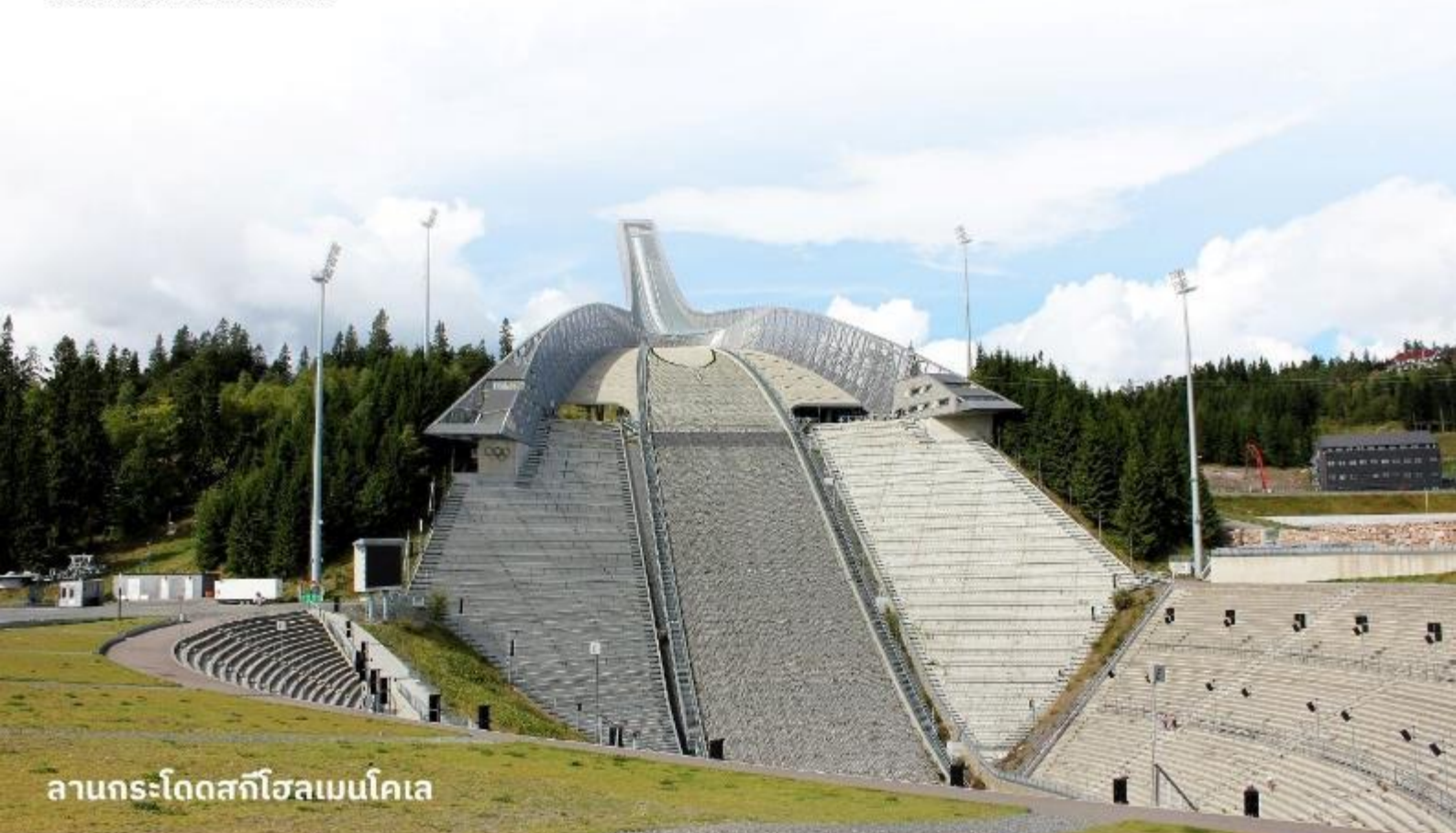
ลานกระโดดสกีโฮลเมนโคเลน

จากนั้นนำท่านเดินทางสู่ ลานกระโดดสกีโฮลเมนโคเลน (Holmenkollen Jump Ski Arena) ตั้งอยู่ในเมืองออสโล ประเทศนอร์เวย์ เป็นหนึ่งในสถานที่ที่มีชื่อเสียงในวงการสกีกระโดด มีประวัติยาวนานและเป็นที่รู้จักอย่างกว้างขวางในการแข่งขันสกีกระโดดและการแข่งขันกีฬาฤดูหนาวอื่นๆ นอกจากนี้ยังมีพิพิธภัณฑ์เกี่ยวกับกีฬาและศูนย์ข้อมูลเกี่ยวกับประวัติศาสตร์ของการสกีกระโดดให้ผู้เยี่ยมชมได้ศึกษาด้วย