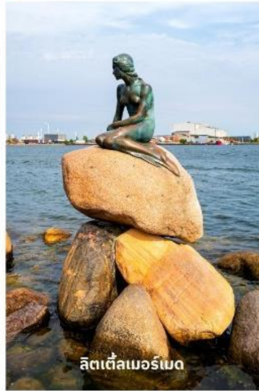
ลิตเติ้ลเมอร์เมด