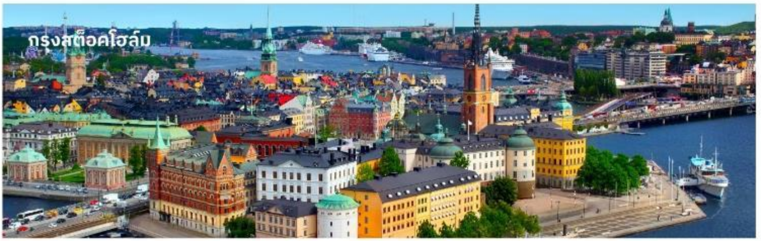
กรุงสต็อกโฮล์ม

จากนั้นนำท่านเข้าชม พิพิธภัณฑ์เรือวาซา ซึ่งตั้งโชว์เรือรบโบราณที่กู้ขึ้นมาได้จากที่ใต้ทะเลและยังคงสภาพที่สมบูรณ์ จัดเป็นพิพิธภัณฑ์ที่มีชื่อเสียงที่สุดแห่งหนึ่งในสต็อกโฮล์มเรือวาซานั้นสร้างขึ้นเมื่อปี ค.ศ.1628 เพื่อให้เป็นเรือรบที่ใหญ่ที่สุด โดยบรรจุปืนใหญ่ถึง 64 กระบอก แต่เพียงวันแรกที่ออกเดินทางได้ประมาณ 500 เมตร เรือก็จมลงสู่ใต้ทะเลลึก 35 เมตร และในศตวรรษที่ 20