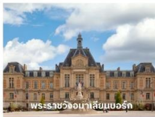
พระราชวังอมาเลียนบอร์ก