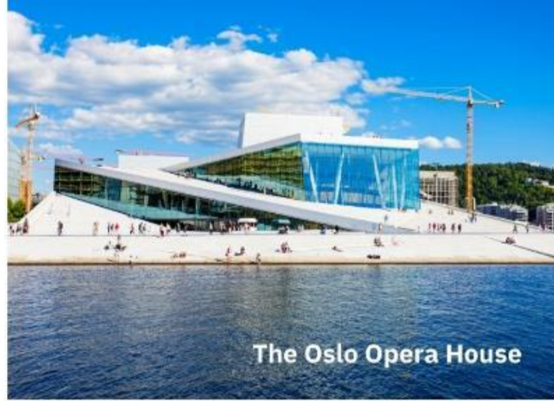
The Oslo Opera House

นำท่านเข้าสู่ที่พัก Scandic Helsfyr หรือเทียบเท่า