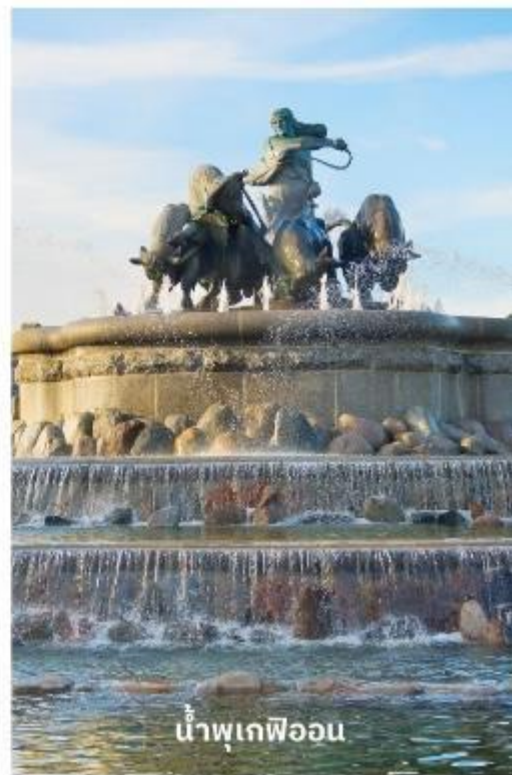
น้ำพุเกฟิออน