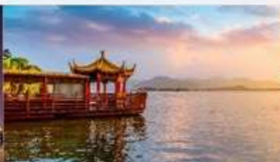
ล่องเรือชมทะเลสาบซีหู