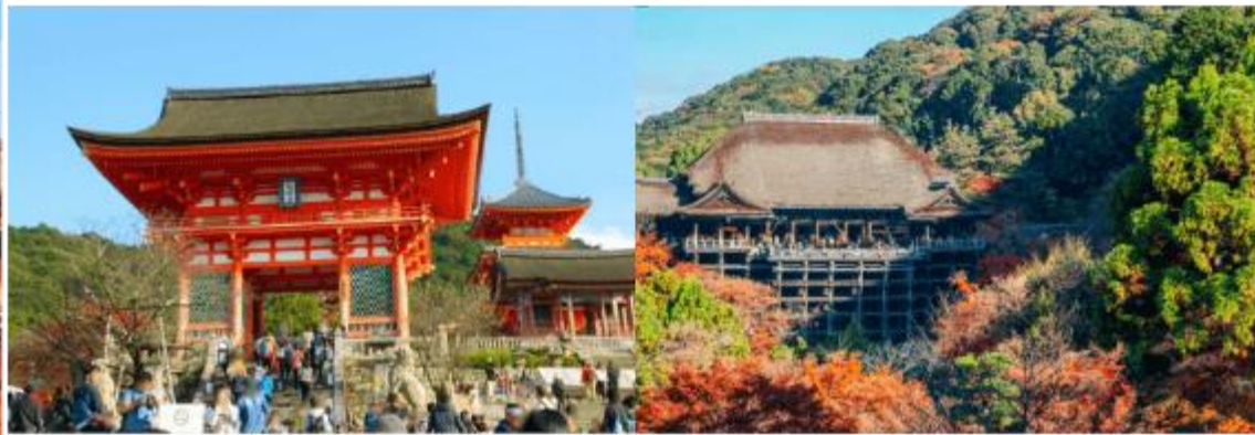
วัดคิโยมิซึ

จากนั้นนำท่านสู่ วัดคิโยมิซึ (Kiyomizu Temple) หรือที่รู้จักกันในชื่อว่า วัดน้ำใส เป็นวัดเก่าแก่คู่เมืองเกียวโต ที่มีชื่อเสียงเป็นอย่างมากในเรื่องของสถาปัตยกรรมและทิวทัศน์ที่งดงาม โดยเฉพาะในฤดูใบไม้ผลิและใบไม้เปลี่ยนสี ทักษณียภาพอันงดงามของวัดโบราณที่ตั้งอยู่บนเนินเขา ทำให้วัดแห่งนี้ได้รับการขึ้นทะเบียนเป็นมรดกโลก รวมถึงสายน้ำบริสุทธิ์ 3 สายที่ไหลมาจาก น้ำตกโอดะวะ (Otowa Waterfall) เชื่อว่าเป็นสายน้ำที่มีความใสสะอาดบริสุทธิ์ และสามารถขจัดปัดเป่าสิ่งไม่ดีออกไป ชาวญี่ปุ่นจึงนิยมมาดื่มน้ำแต่ละสายเพื่อความเป็นสิริมงคลกัน