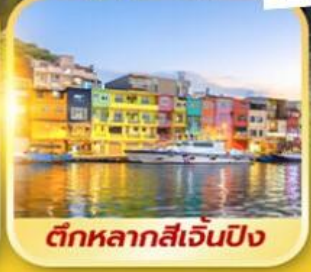
ตึกหลากสี่เจิ้นปิง