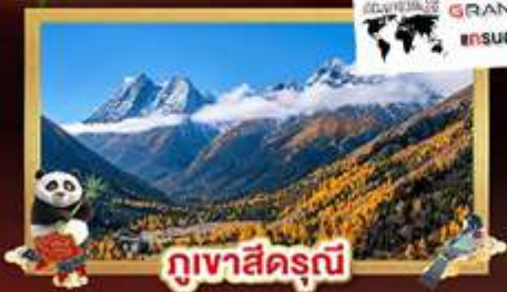
กูเขาสี่ครุณี