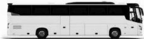
รถนำผู้โดยสาร 1 คัน

หากประเภทห้องที่ท่านได้จองมาเต็มจาก เช่น ไร่ควนค้อของพักเป็น TWIN BED หรือ DOUBLE BED ทางบริษัทขอสงวนสิทธิ์ในการปรับประเภทห้องพัก เป็นตามที่โรงแรมมีอยู่ โดยไม่ต้องแจ้งให้ทราบล่วงหน้า