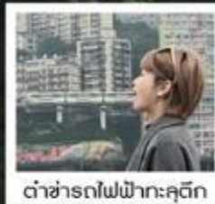
ต้าซ่ารถไฟฟ้าทะเลตึก