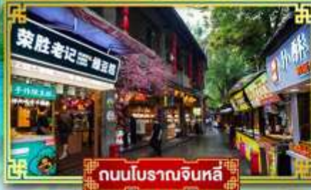
ถนนโบราณจินหลี่