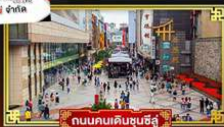
ถนนคนเดินชุนชี่