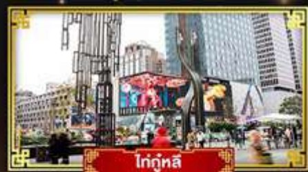
ไท่กู่หลี่