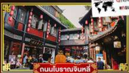
ถนนโบราณจีนหลี