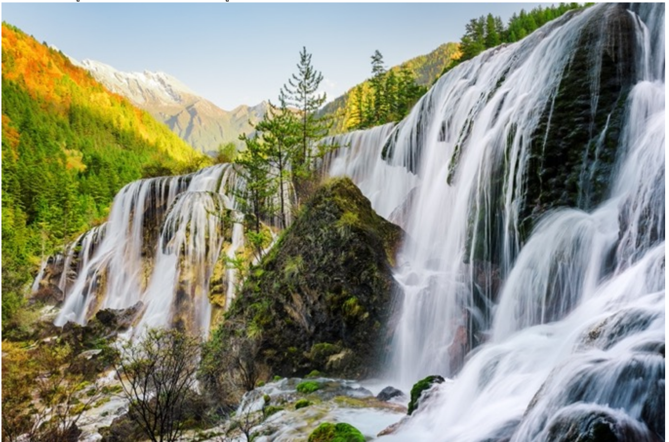
ฤดูใบไม้ร่วง (AUTUMN)