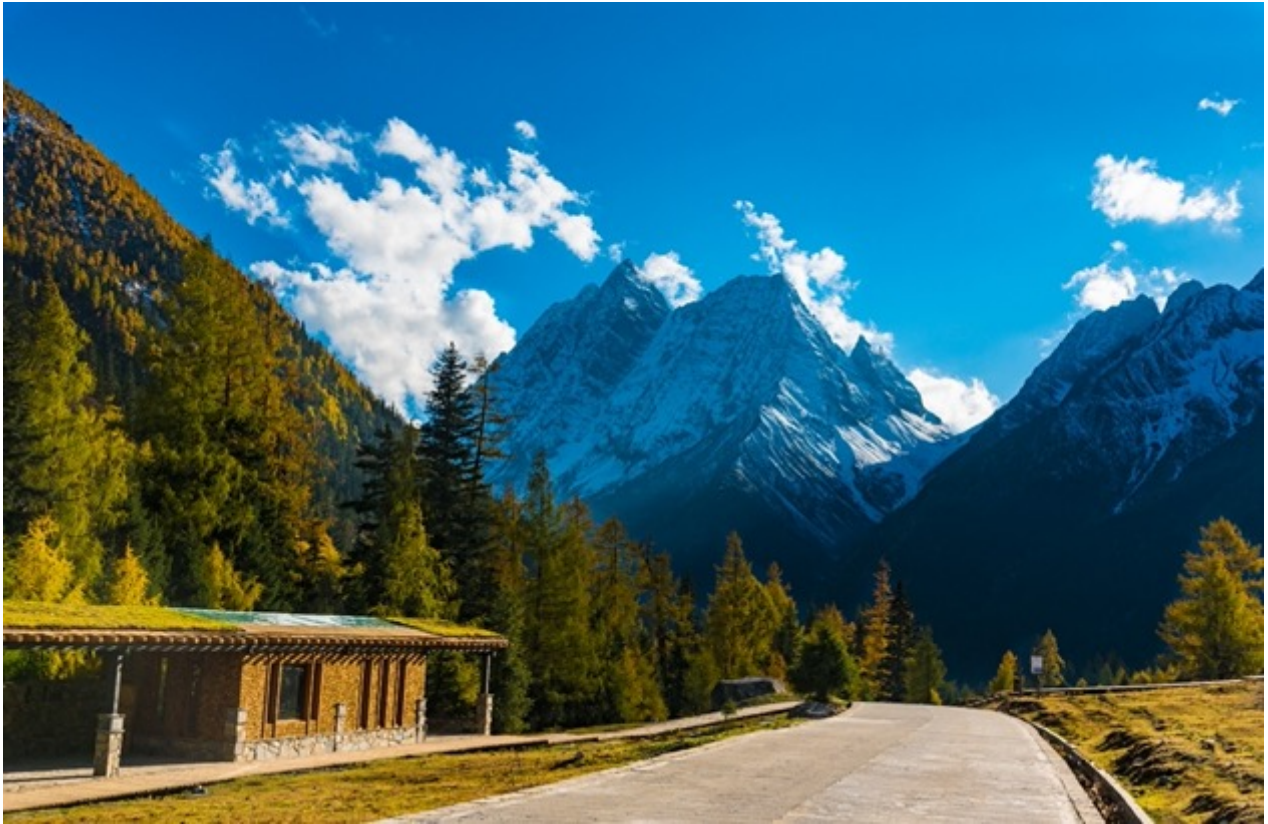
ฤดูใบไม้ร่วง (AUTUMN)