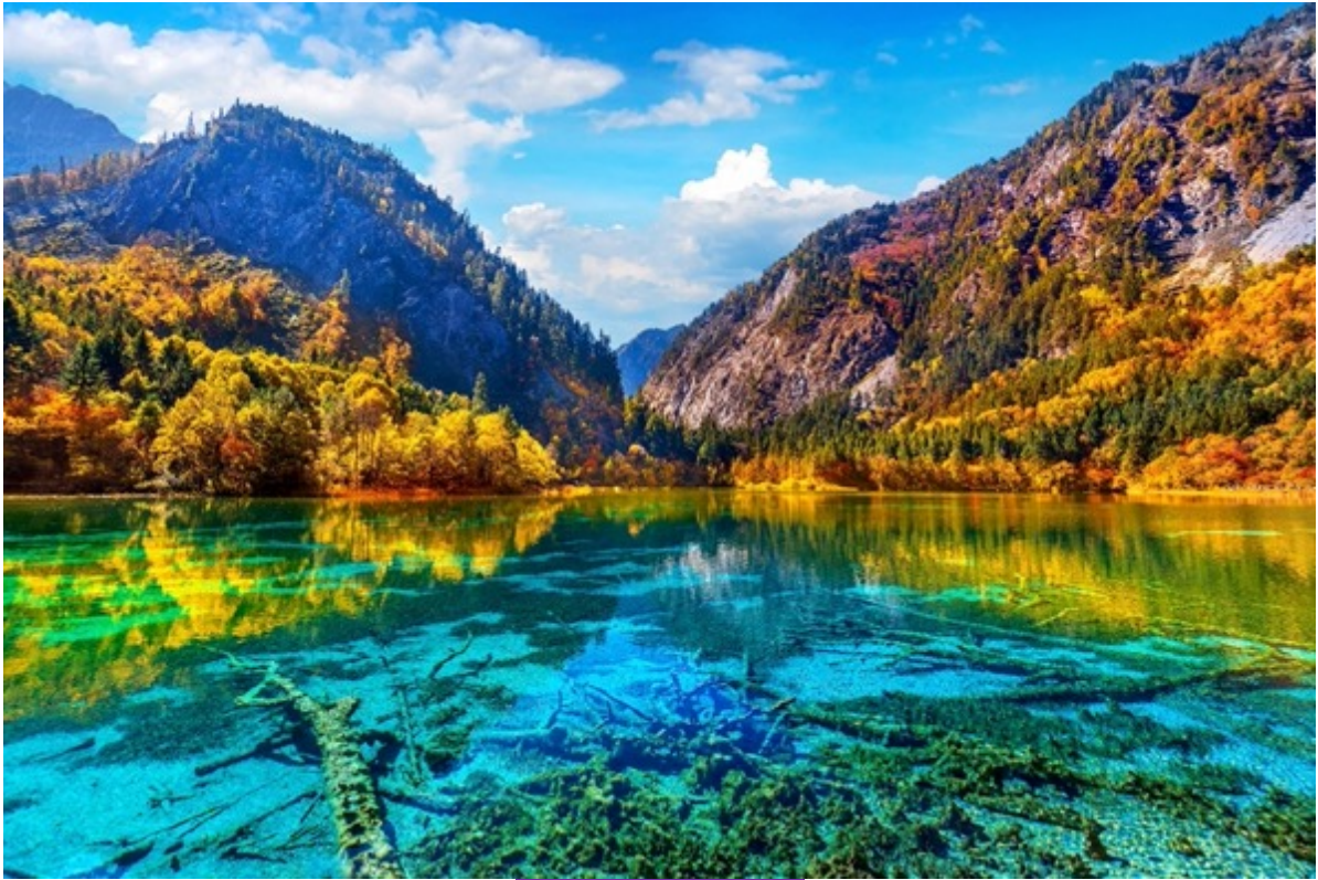
ฤดูใบไม้ร่วง (AUTUMN)