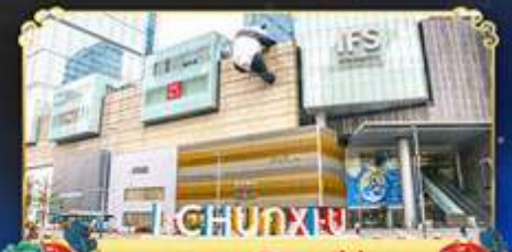
ถนนคนเดินชุนซีอู่