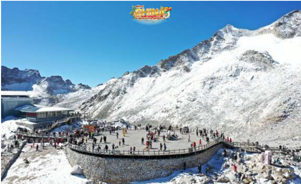
(หมายเหตุ: ปริมาณหิมะขึ้นอยู่กับสภาพอากาศ)