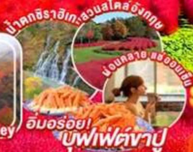
อ้อมรอย! บู่ฟิฟัตซาปู

ไฮไลท์!! ชมทุ่งโคเคียว 32,000 ต้น และ สวนสโคโนงทฤษฎ ณ ยูนิการ์เด็น ข้าววว!! ชมใบไม้เปลี่ยนสี ที่โจซังเคออนเซ็น (โจซังเคออนเซ็น) หุบเขาใบไม้เปลี่ยนสี สถานที่สุดแสนโรแมนติก โซออนเคียว นั่งกระเช้าไฟฟ้าคโรคาเกะ ชมอุทยานแห่งชาติที่ใหญ่ 1 ใน 3 ของประเทศญี่ปุ่น ชม สระอะโอะอิเคะ (Aoiike) หรือที่เรารู้จักกันอีกชื่อหนึ่งว่า " สระน้ำสีฟ้า (Blue Pond) "