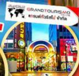
ช้อปปิ้ง ถนนทานุกิโคจิ