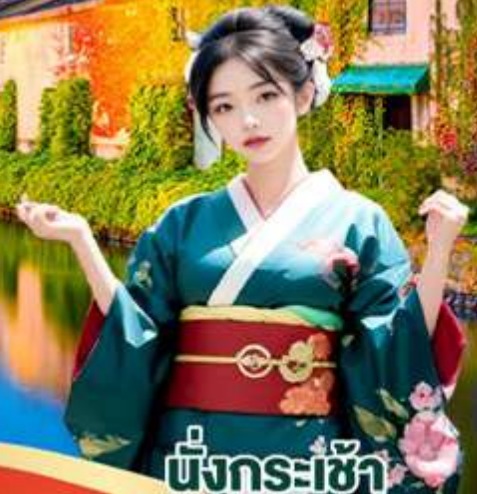
นั่งกระเช้า พร้อมชมใบไม้เปลี่ยนสี Mt.Usu Ropeway