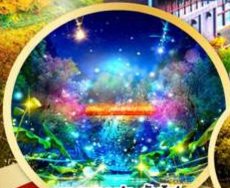
เทศกาลประดับไฟ โจซังเคนเนเจอร์ลูมินาเรียะ