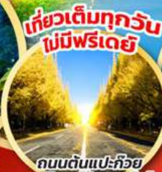
ถนนต้นแปะก๊วย มหาวิทยาลัยฮอกไกโด