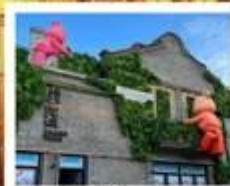
ลิคชิวรี่ จางหยวน