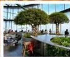
ร้านหนังสือตั่วอวี่น

เซี่ยงไฮ้ คลาสสิก ไนท์ (Shanghai Classic Night) / เช็กเมนู 3 ดิกใหญ่แห่งเซี่ยงไฮ้ / ร้านหนังสือตั่วอวี่น / Shanghai Circus World / หมู่บ้านโบราณจูเจียเจียว วัดหลงหัว / STARBUCKS RESERVE / ลิคชิวรี่แลนด์มาร์ค จางหยวน / ถนนหยูไท่ (ร้านกระเป่า Song mount) / วัดจิ่งอัน / ถนนคนเดินเทียนจื่อฟาง Tian An 1,000 Trees Square / North Bund Green Land / ตลาดเจิ้งหวังเมี่ยว / สวนอีหยวน / หอไข่มุก