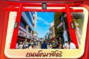
ถนนโคมาจิโดริ

ชมเสน่ห์เมืองเก่าคามาคูระ สักการะพระใหญ่โอดะดะสึกามาคูระ เดินเล่นถนนโคมาจิโดริ ชมวิวฟูจิท่ามกลางอากาศเย็นสบาย ที่สวนโออิชิ ขึ้นจุดชมวิวจีน 5 ของภูเขาไฟฟูจิ ปิดท้ายด้วยช้อปปิ้งจุใจในโตเกียวที่ย่านชินจูกุ