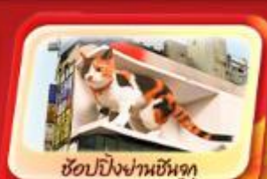
ช้อปปิ้งผ่านชินจูกุ