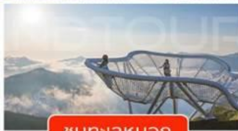
ชมทะเลนอก