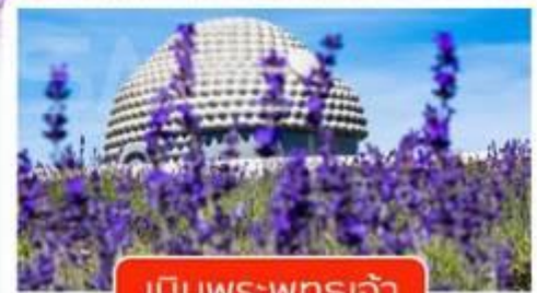
เป็นพระพุทธรเจ้า