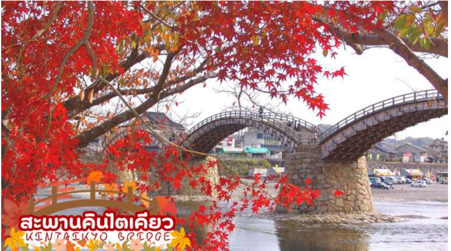
สะพานคินไตเคียว KINTAI KYO BRIDGE

จากนั้นนำท่านเดินทางสู่ เมืองอิวาคุนิ เยี่ยมชมความงามของ สะพานคินไตเคียว (Kintai Kyo Bridge) สะพานไม้ 5 โค้ง 1 ใน 3 สะพานที่สวยงามที่สุดในญี่ปุ่น สร้างครั้งแรกเมื่อปี พ.ศ. 2216 แต่พังทลายลงในปีต่อมา จึงได้มีการสร้างขึ้นใหม่และอยู่มายาวนานกว่า 270 ปีจนกระทั่งถึง พ.ศ. 2493 สะพานแห่งนี้ได้พังทลายเพราะถูกพายุไต้ฝุ่นคิชิยะพัดทำลาย ชาวอิวาคุนิเลยพร้อมใจกันสร้างสะพานขึ้นมาใหม่อีกครั้งตามรูปแบบเดิม