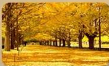
สวนโซวะคิเอน