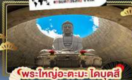
พระใหญ่อะตะมะไดบุตสึ