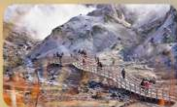
โนโบริเบทสึ

SAPPORO HOTEL AREA หรือเทียบเท่ามาตรฐานญี่ปุ่น