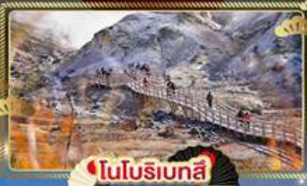
โนโบริเบทสึ