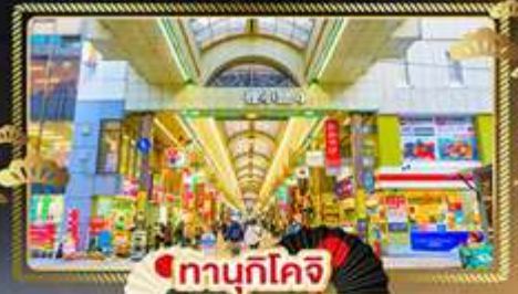
ทานุกิโจจิ