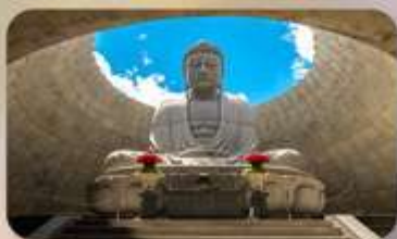
พระใหญ่อะคะมะ โดบุคสึ