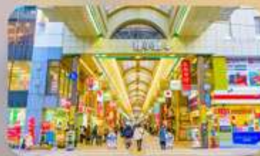
ทานุกิโจจิ