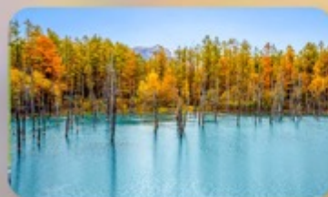
บ่อน้ำฟ้า