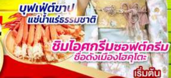
บุฟเฟ่ต์ขาปู แช่น้ำแร่ธรรมชาติ