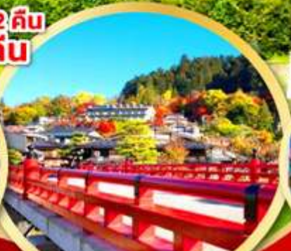
เมืองเก่าทาคายาม่า