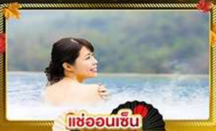
แช่ออนเซ็น