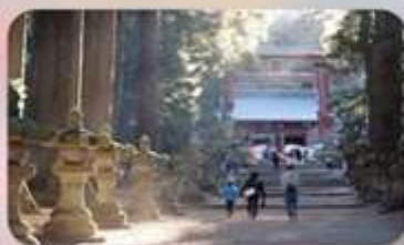
ศาลเจ้าคิตะกุจิฮอนกุ ฟูจิ เซ็นเกิน