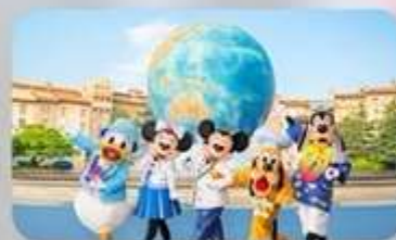
อิสระตามอัธยาศัย 1 วัน