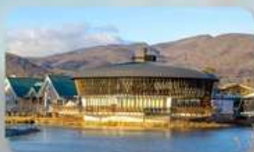
คุรุซาว่า เอ้าเล็ก