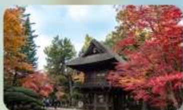
วัดเฮรินจิ