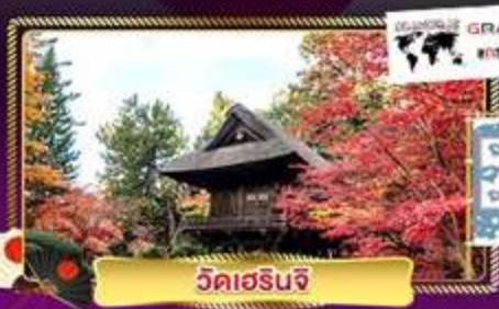
วัลเดรินจิ