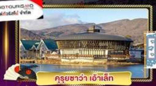
คุรุชิวาว่า เอ้าสิค