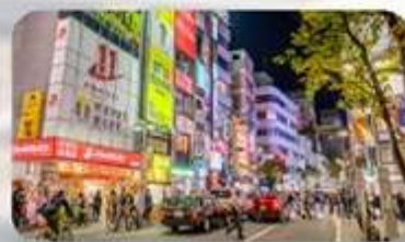
ย่านเทนจิน