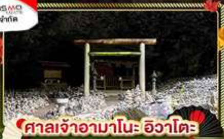
🏯 ศาลเจ้าอามาโนะอิวาโตะ