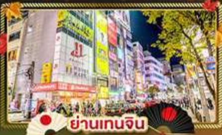
🇯🇵 ย่านเทนจิน