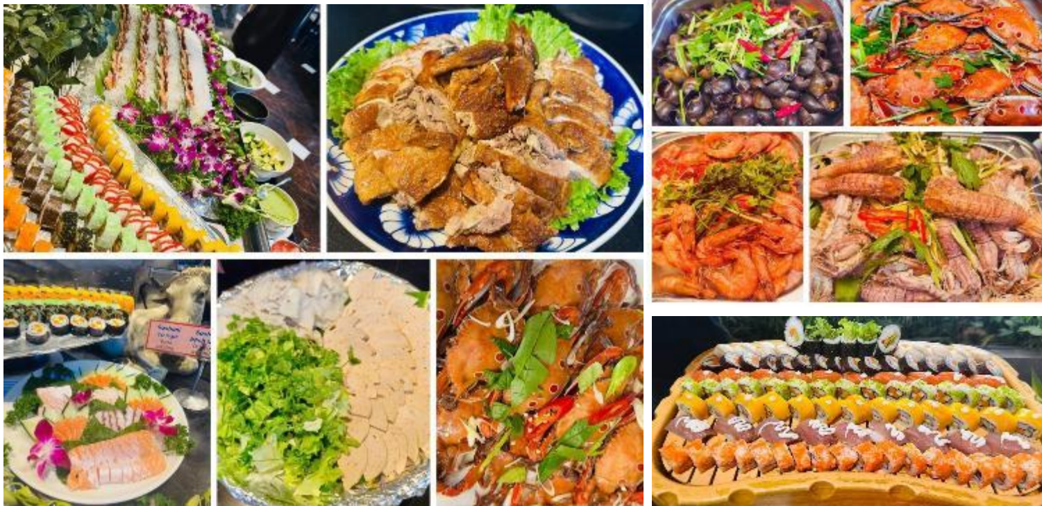
รูปภาพใช้ประกอบการโฆษณาเท่านั้น

ได้เวลาอันสมควร นำท่านเดินทางกลับสู่สนามบินนานาชาติดานัง เพื่อเดินทางกลับสู่ประเทศไทย