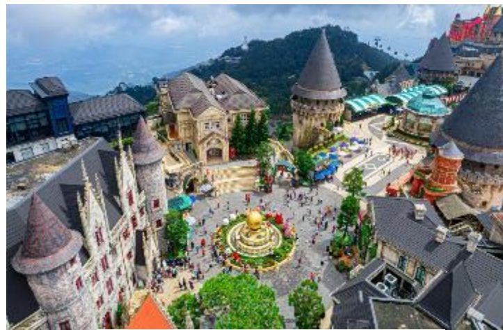
รูปภาพใช้ประกอบการโฆษณาเท่านั้น

นำทุกท่านได้สัมผัสกับประสบการณ์สุดเหวี่ยงที่ สวนสนุกในร่ม (Fantasy Park) สวนสนุกในร่มที่ใหญ่ที่สุดของเวียดนามอยู่บนเขาบานาฮิลล์ (ราคาตั๋วรวมค่าเครื่องเล่นภายในสวนสนุกทุกเครื่องเล่น ยกเว้นพิพิธภัณฑน์หุ่นขี้ผึ้ง โรงบ่มไวน์ รถไฟเหาะ Alpine Coaster และเครื่องเล่นที่ใช้ระบบหยอดเหรียญ) นำท่าน นั่งรถรางขึ้นเขาไซนใหม่ บนบานาฮิลล์ ได้แก่ Bana Waw และ Luna Castle เป็นโซนที่เปิดใหม่ล่าสุดของบานาฮิลล์ ในโซนเปิดใหม่นี้จะต้องนั่งรถราง Tram ต่อเข้ามายังปราสาท มี 4 ชั้น ในแต่ละชั้นจะมีธีมที่แตกต่างกัน สามารถเดินถ่ายรูปได้ทุกจุด เพราะแต่ละจุดตกแต่งออกมาได้สวยงามๆ