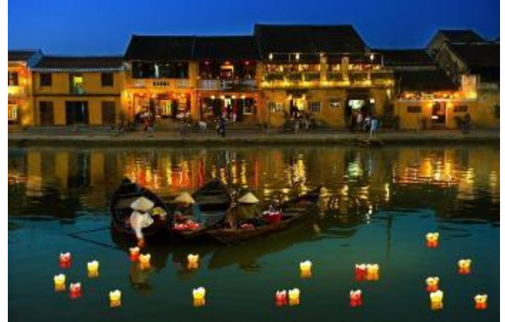
รูปภาพใช้ประกอบการโฆษณาเท่านั้น

นำท่าน ล่องเรือยามเย็นที่เมืองฮอยอัน (Thu Bon River Cruise) เป็นประสบการณ์ที่ไม่ควรพลาดเมื่อมาเยือนเมืองเก่า การล่องเรือโคมลอยในแม่น้ำ ให้ท่านได้ดื่มด่ำกับบรรยากาศอันเป็นเอกลักษณ์ของเมือง ปล่อยโคมลอยในแม่น้ำและชมเมืองเก่าที่ได้รับการขึ้นทะเบียนเป็นมรดกโลกโดยยูเนสโก สัมผัสทัศนียภาพและกลิ่นอายของฮอยอันในยามค่ำคืน