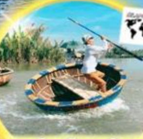
ล่องเรือกระดังง์