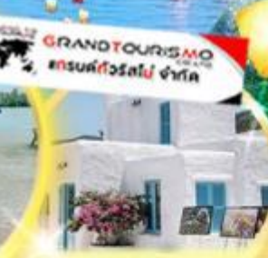
SON TRA MARINA CAFE