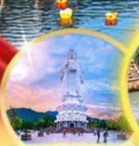
เจ้าแม่ทวนอิมวัดหลินอึ้ง