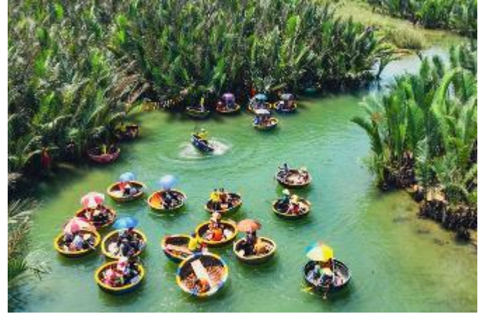
รูปภาพใช้ประกอบการโฆษณาเท่านั้น

จากนั้นนำท่าน ล่องเรือกระดัง ที่ หมู่บ้านกัมทาน (Cam Thanh Water Coconut Village) เป็นหมู่บ้านเล็ก ๆ ในเมืองฮอยอัน ตั้งอยู่ในสวนมะพร้าวอวมี่แม่น้ำ ให้ท่านได้สนุกสนานเพลิดเพลินกับการ ล่องเรือไปตามสายน้ำ ชมธรรมชาติและวัฒนธรรมท้องถิ่นใช้เวลาประมาณ 40 นาที